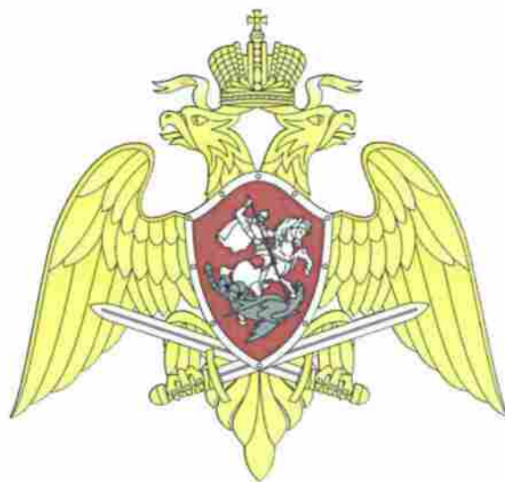
Рисунок геральдического знака - эмблемы войск национальной гвардии Российской Федерации. Многоцветный вариант.