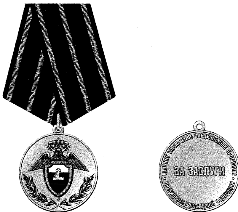
РИСУНОК медали «За заслуги»

Медаль при помощи ушка и кольца соединяется с пятиугольной колодкой, обтянутой шелковой муаровой лентой темно-красного цвета шириной 24 мм с желтыми полосами по краям. Посередине ленты желтая полоса шириной 2 мм.