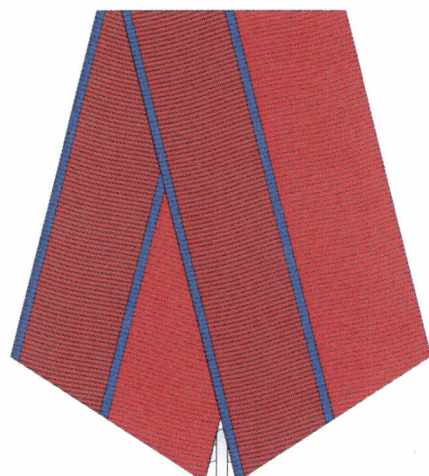
РИСУНОК медали «Генерал от инфантерии Е.Ф. Комаровский»